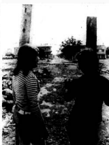
Das muchachas capitalinas se asoman a la 15 de septiembre llenas de recuerdos y de antigua actividad. Ya tiene luminaria y sólo falta que suban el "twich" y derriben el cerco.

Más hacia abajo, todo está limpo, no hay más puntos de referencia y sólo surgen casi llegando a San José, las bases de la gasolinera Las Casas, se fue al suelo Chico Che Rapuente, la P del 11, y naturalmente la difícil casa de "La Cholla" por donde más de un diploctemo murió. Fue destruido por sus resquebrajos en su estado para darle el último salubio La Cholla.